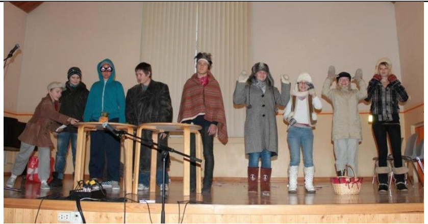
Playbackil saavutas 3. koha 6. klass oma esinemisega „Kurgid sulle, raha mulle!“

Lõpetuseks suur aitäh kõigile, kes osalesid ning aitasid õpilasomavalitsusel seda üritust korraldada.