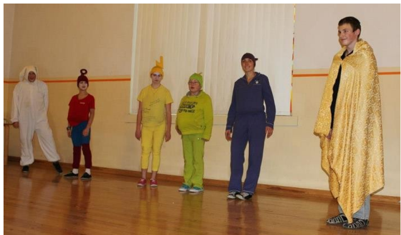
7. klassi etteaste ehk teletupsud Playbackil

„Playbackile otsustasime minna viimasel hetkel. Kahjuks ei olnud kõik nõus esinema ja seetõttu pidime teistest klassidest osatäitjaid leidma. Hakkasime harjutama alles viimasel nädalal. Lõpuks kukkus lava peal ikka kõik teisiti välja kui harjutades.“