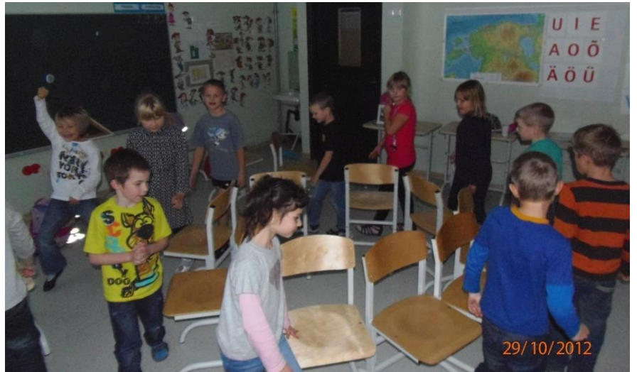
Toolidemäng on klassiõhtutel traditsiooniline