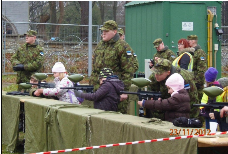
Staabi- ja Sidepataljonis: midagi tõsisemat kui pastakas ja tatikuulid

Kolmandat korda viis tee meid Pagaripoistesse. Seal me nägime, kuidas valmivad kringlid, küpsised, tordid ja piparkoogid. Saime suu magusaks erinevate küpsistega. Veel tutvustati meile, kuidas ja millal taigen valmib ja kuidas neist pirukad valmis saavad. Meelde jäi lastele rulliskude rullikud, mis aitasid mitmeid pirukaid õigest kohast kokku vajutada. Seljas pidid olema naljakad kitlid ja mütsid ning sinised kilesussid.