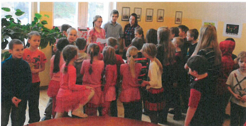
Enne südame otsimist

1.-3. klass sai reedel otsida südameid, nagu on olnud iga aasta. Peale selle oli kõigil võimalus võtta oma sõbral varrukast ja viia ta esimesele korrusele pikapäeva ruumi sõbrapaela punuma. Kogu nädala vältel olid klassidel ülemise korruse vahesaalis üleval postkastid, kuhu sai oma sõbrale kirja jätta. Reedel jagati need kätte ja peale seda kõik kallistasid ja tänasid oma sõpru kaartide/kinkide eest. Kõik olid väga rõõmsad. Reedel oli kõigil sõpradel panna selga samasugune riietus. Väikeste pooltel oli väga palju punast ja roosat, see oli äärmiselt nunnu.