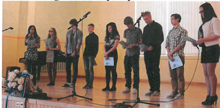
9. klass aktusel esinemas