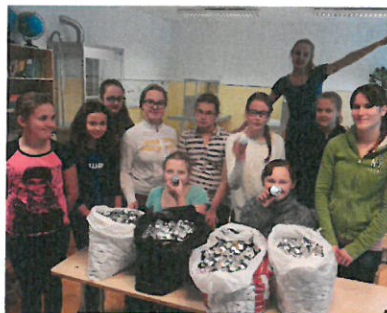
Ääsmäe Põhikooli 6. klass oma kogutud teeküünläümbristega

Küünläümbriste jaht toimus juba teist korda ning oli tänava veelgi edukam kui eelmisel aastal – kokku kogusid Eesti kooliõpilased üle 1,5 miljoni teeküünläümbrise, mille kogukaaluks oli üle kahe tonni.