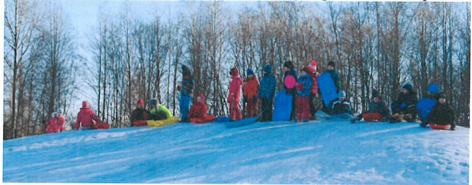
1. klass vastlapäeva tähistamas

Vastlapäeva tähistamine oleks sel aastal äärepealt ohtu sattunud kuna tänavune talv just külma ja lumerohkusega veebruaris silma ei paistnud. Sellest hoolimata ei jäänud vastlaliud siiski tegemata, sest koolimaja taga mäel oli lund piisavalt.