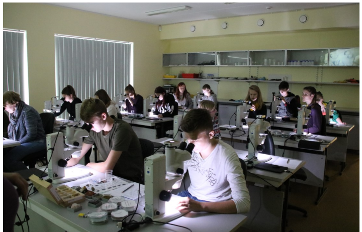
11 oktoobril käis 9. klass Särghaua õppekeskuses

9. klass läbis KIK projekti raames programmi „Kivimid ja mineraalid“ Tallinna Tehnikaülikooli Särghaua õppekeskuses. Tutvuti maakoore ehitusega kiviminäidiste põhjal. Mikroskoopidega uuriti erinevaid kivimeid ja mineraale. Praktilise töö käigus sai iga õpilane tegeleda kivi saagimise, lihvimise ja poleerimisega. Teise külaskohtu kohana tutvuti C.R Jakobsoni eluloo ja tegemistega C.R. Jakobsoni Talumuuseumis Kurgjal.