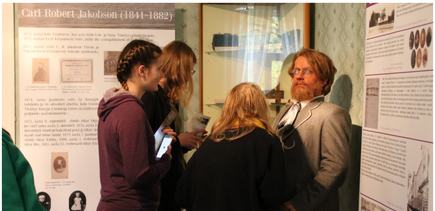
C.R. Jakobsoni talumuuseumis Kurgjal