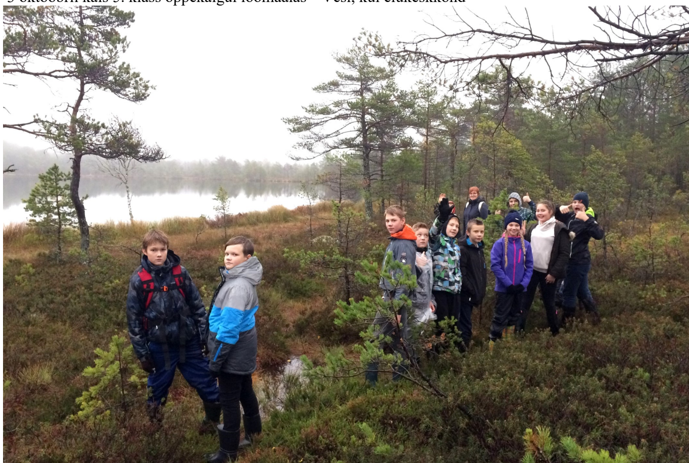
17 oktoobril käis 6. klass rabas "Virtuaalne ja reaalne retk Rabivere rappa"