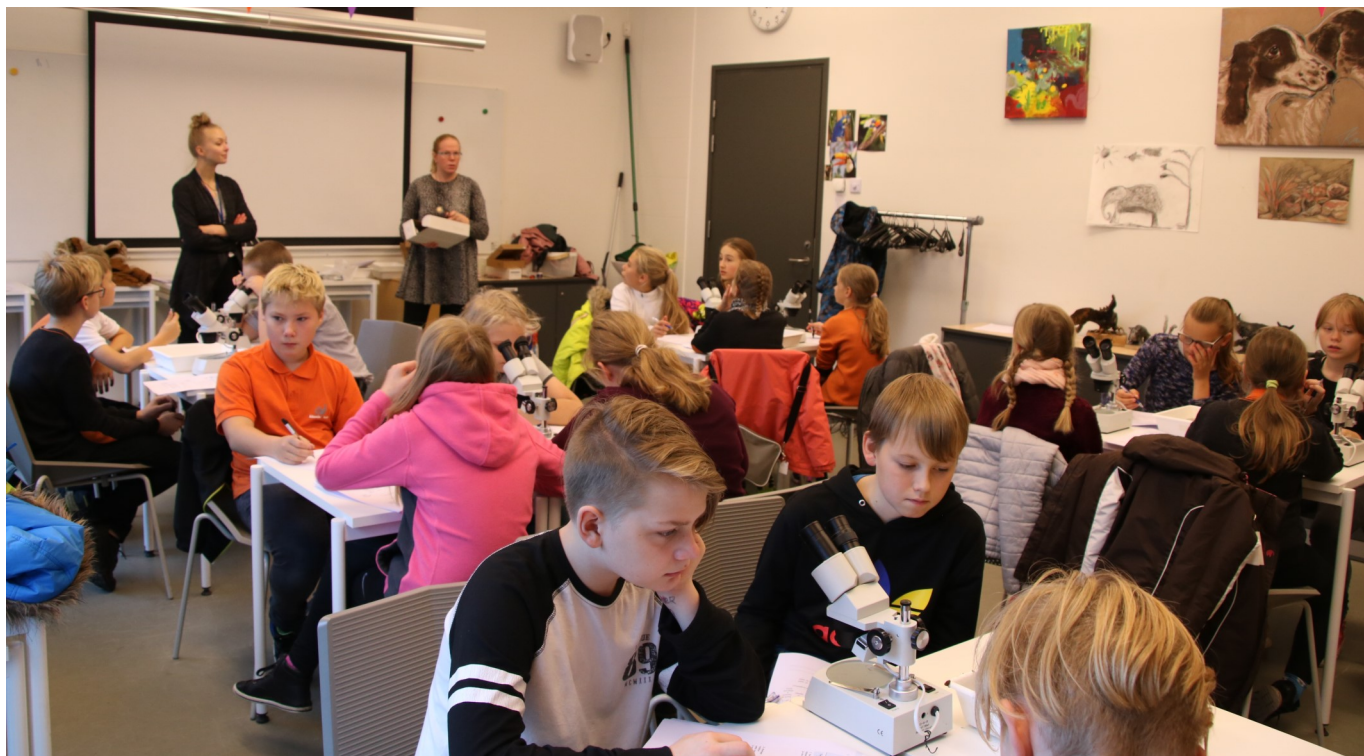
3 oktoobril käis 5. klass õppekäigul loomaaias "Vesi, kui elukeskkond"

projekti raames saavad kõik klassid käia väljaspool kooli ühe loodushariduslikul õppekäigul.