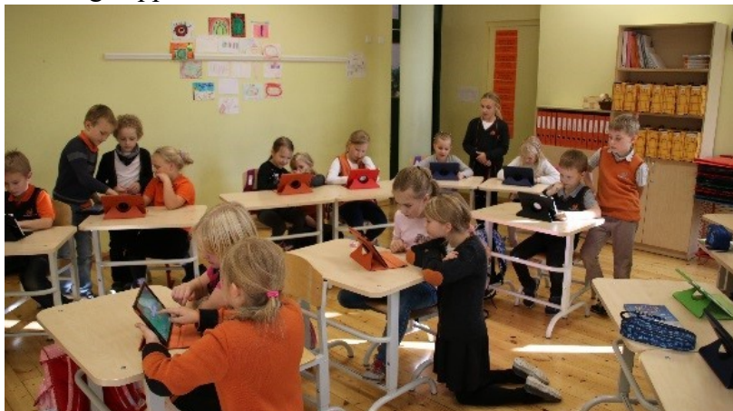
Väikesed õpetajad ametis õpetamisega