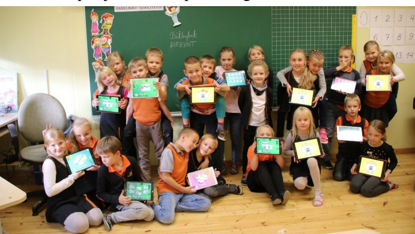
Rõõm tehtud tööst