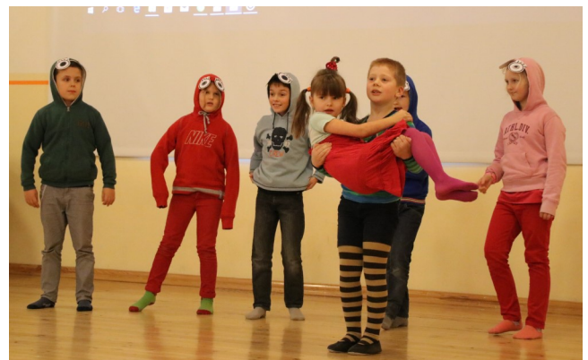
III koht ja publikulemmik