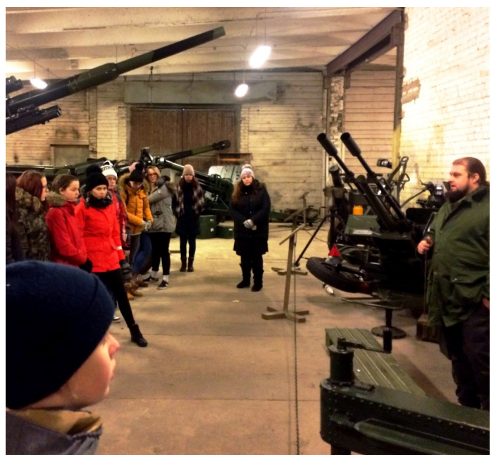
Johan Laidoneri Sõjamuuseumi külastus