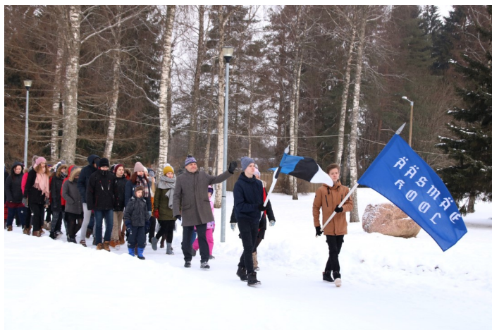
EV 100 pidulikud hetked