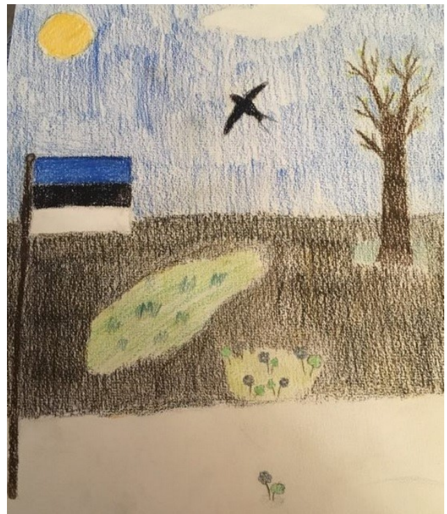
Joonistus: Laura Mellik

Eestis on hea elada. Me armastame Eestit. Eesti on meie kodumaa ja jääb selleks alati.