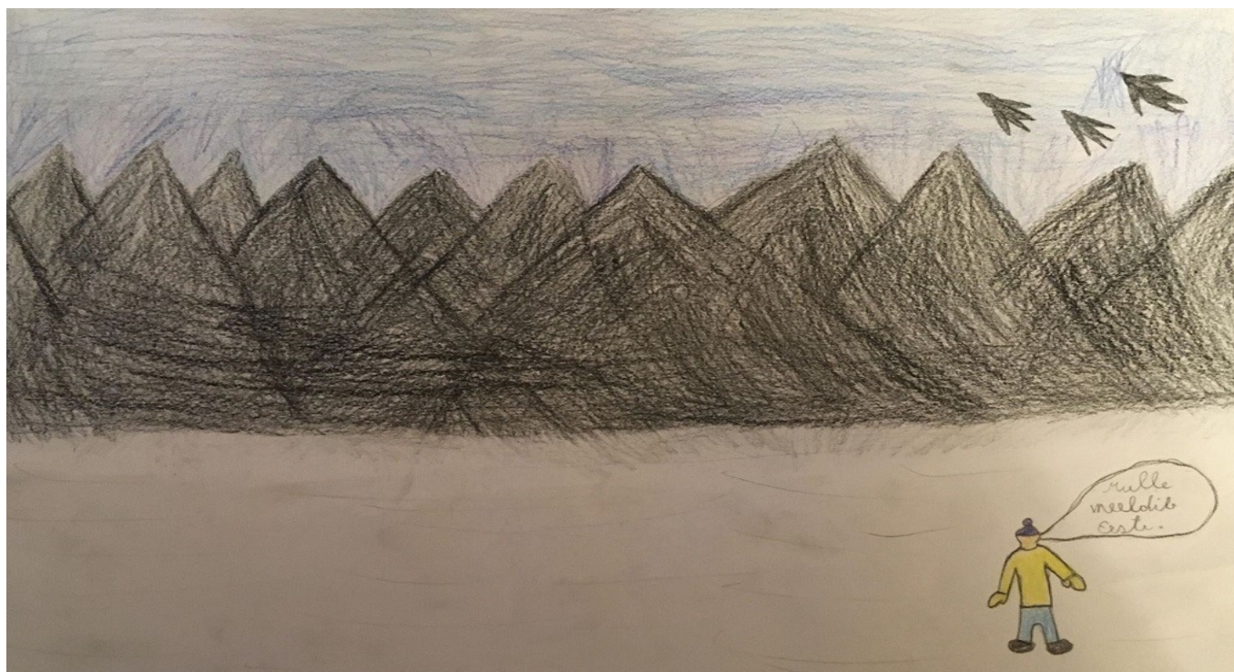
Joonistus: Vladimir Ilinõh 4.b klass

Tornaadosid ka õnneks pole. On päike, lumi, vihm ja rahe. Rukkililled õitsevad. Eesti toit on kõige parem.