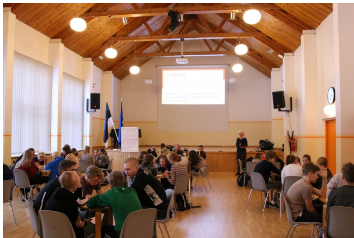
Viktoriin kooli aulas

19. veebruaril toimus 5.–9. klassidele teine viktoriinivoor, mis seekord oli pühendatud Eesti vabariigi aastapäevale. Esimene voor toimus novembrikuus. Küsimused puudutasid Eestit ja jagunesid järgmisteks valdkondadeks: poliitika, loodus, kultuur, ajalugu, varia.