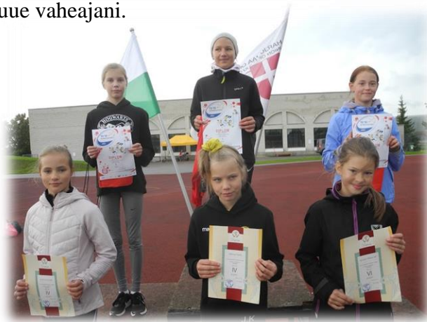
Harju TV 10 OS III etapp 2020 Elis (taga keskel) I koht

Oma 50. hooaega alustab TV 10 Olümpiastardi võistlussari, kuhu meie kooli parimad minemas on. Toimub nii vabariiklik kui ka maakondlik etapp. Jõulude ajal väisame kindlasti mõnda jõuluvõistlust. Eelmisel aastal käisime Tartus ja lapsed said võistlemise vahepeal Jõuluvanaga juttu ajada ning tublimad said mälestuseks medali. Võistlusi on olnud juba omajagu, aga mõnusat ootusärevust jagub kenasti kuni uue vaheajani.