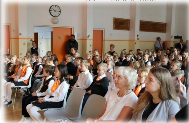
Hetk 2.-8. klassi aktuselt.