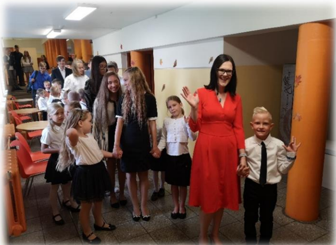
Ootusärevad õpilased enne aktust.