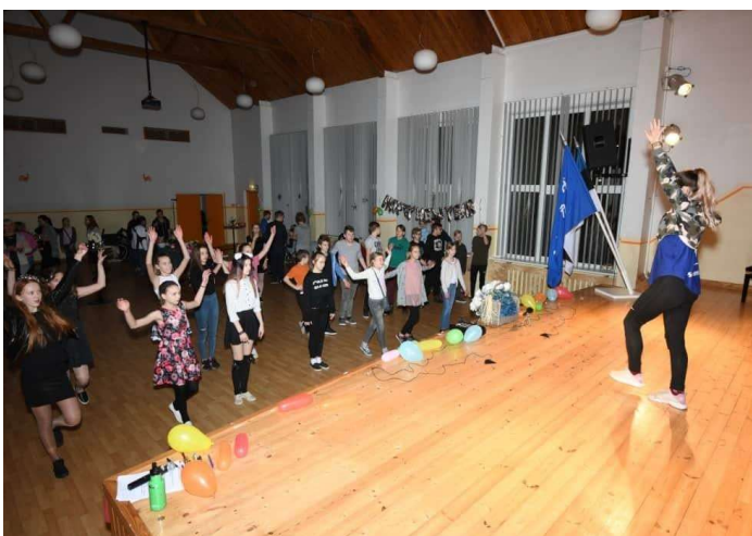
Minu tantsukooli workshop