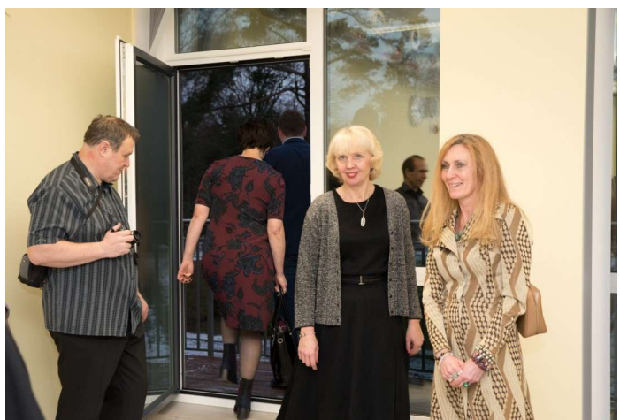
Kes muretses, et vana koolihoone rõdu läks lammutamisele, siis ka uuel koolihoonel on rõdu olemas.