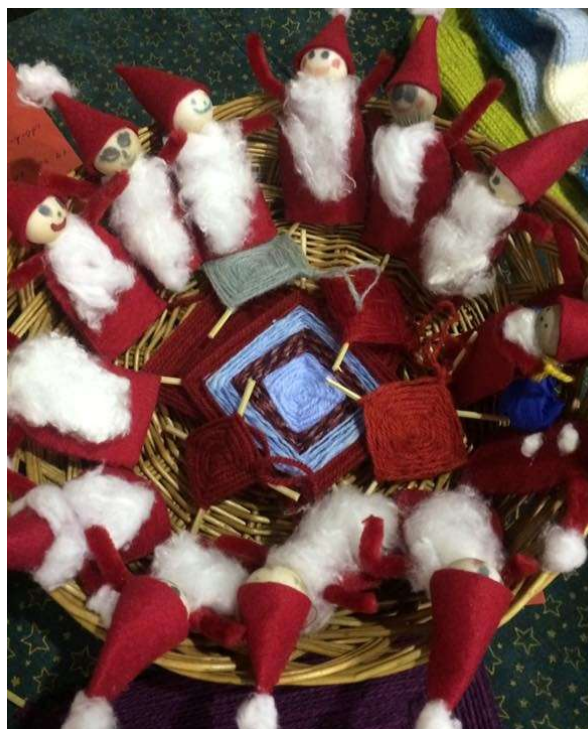
Laste oma panus laadale

Laadalauad oli head ja paremat täis toodud ning vaadates kogunenud väljasõiduraha, läks enamus kaup müügiks.