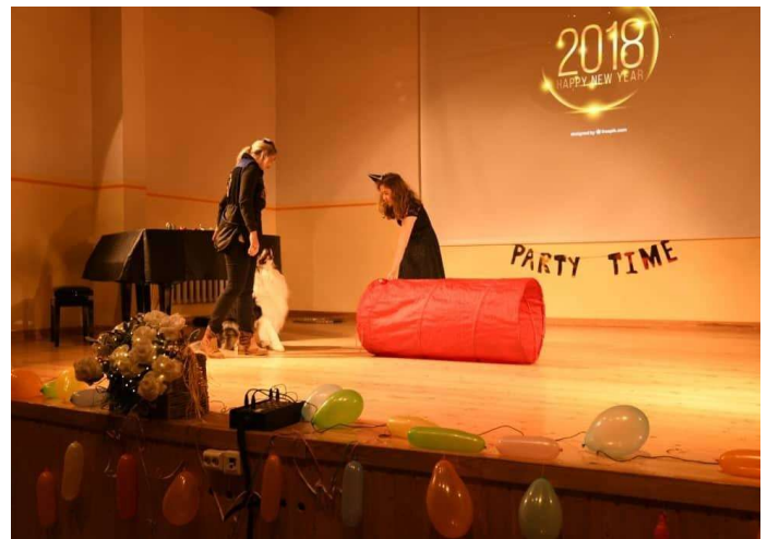
Koera - show