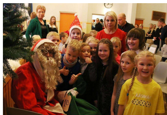
1.B klassi esimene jõulupidu koolilapsena.

Jõulusokk tegi suurematel klassidel olemise lõbusaks.