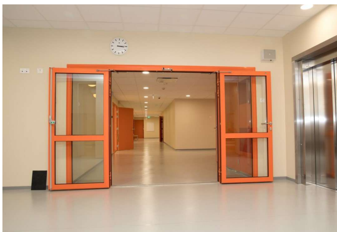
Avar ja lai see uus koolihoone.