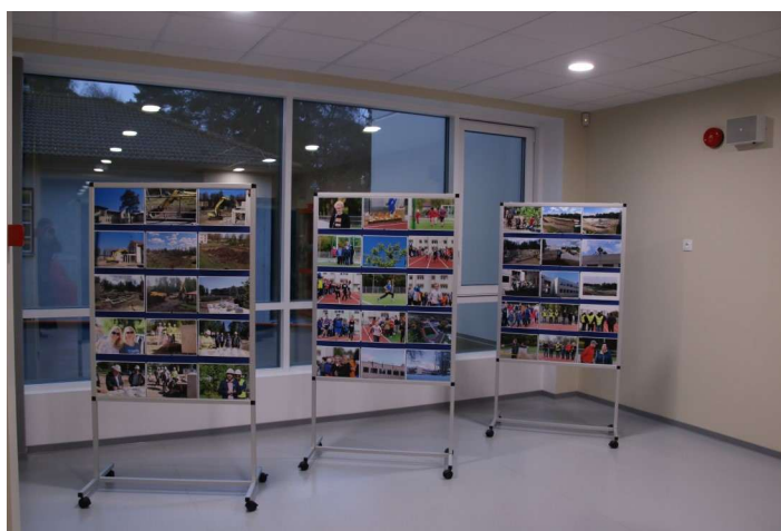
Koolihoone valmimise kroonika.