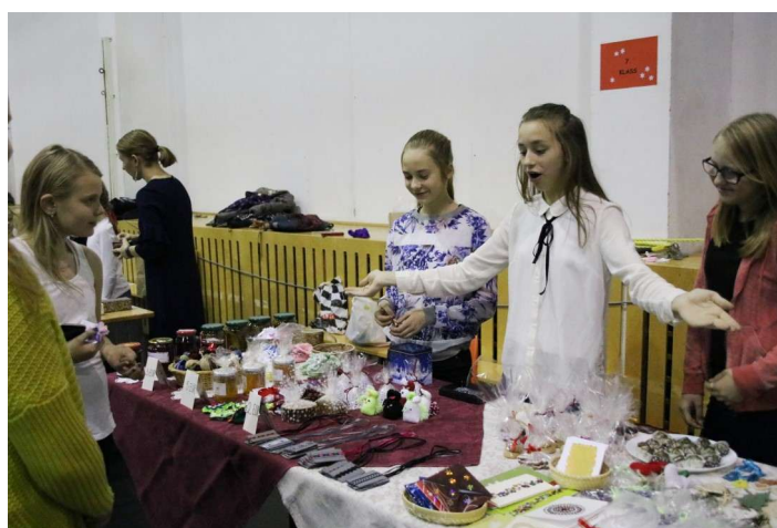
Kes julgemalt pakub see saab oma kaubale kiiremini ostjad