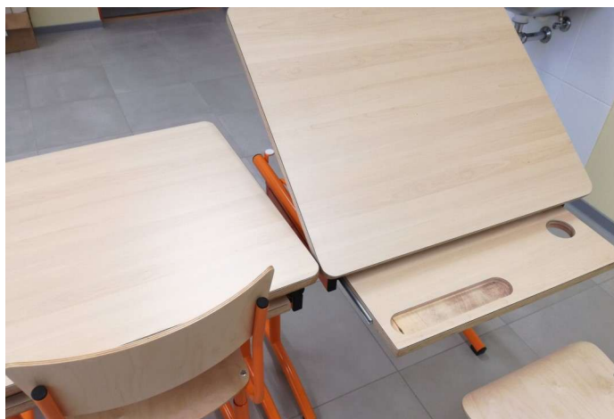
Kunsti klassi uued lauad