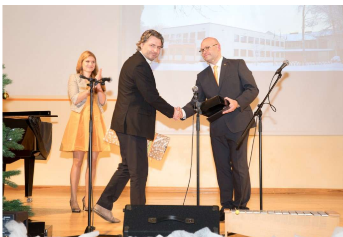
Koolihoone avamisel jagati kingitusi.

Esialgelt lootsime uue koolimajaga tutvuda peale jõuluvaheaga. Kahjuks on tihti uute ehitustega nii, et kõik asjad ja toimetused ei saa õigeaks ajaks valmis. 16. veebruaril tuli lõpuks rõõmusõnum, et nüüd võib kolida sisse. Uues õppekorpuses alustasime peale talvevaheaga, kui kõik vajalik on ümber kolitud.