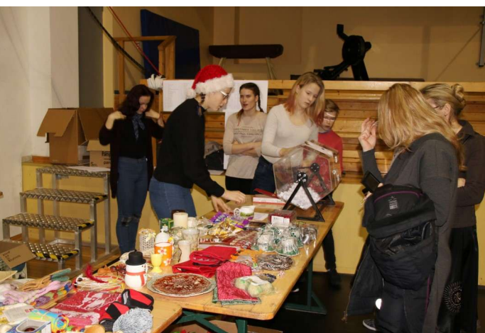
Õnneloosi laud tühjenes kiirelt ja huvilistest puudust ei olnud