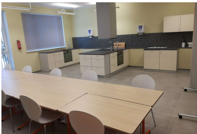
Käsitöö ja kodunduse klass