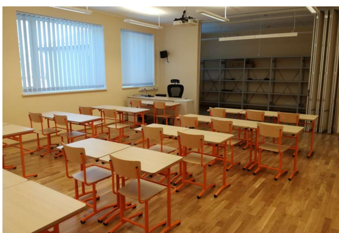
Muusikaklass sai endale pilliruumi.